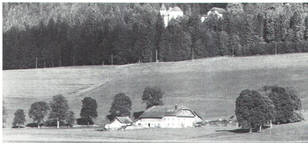
Du fond de la vallée, vue sur le château bâti par les comtes de Neuchâtel au-dessus de Môtiers.

Letztes grosses Ereignis im Val-de-Travers war, sieht man von der im Jahre 1867 errich- teten Textilmaschinenfabrik Dubied in Couvet ab, der Durchmarsch der 80000köpf- igen Bourbaki-Armee im Fe- bruar 1871. Kirchen, Schulen, Häuser, Ställe und Scheunen verwandelten sich in Schlaf- räume, um die völlig erschöp- ften, erkrankten und ausgehun- gerten Russen aufzunehmen. Indem sie dieser Armee von Flüchtlingen Nahrungsmittel und warme Kleider abgaben, zeigten sich die Einheimischen jeden Lobes würdig.