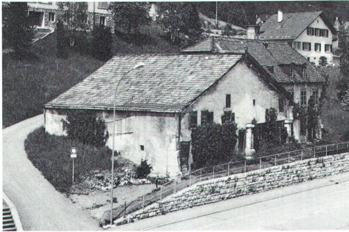
Naguère: condamnée à la démolition après 400 ans (photo d'archives).

Mais voyons brièvement comment les Bourçons (c'est le surnom qu'ils se sont donné) se sont mis à l'œuvre, pour réaliser leur rêve: d'une part, les bénévoles s'activent à démonter, nettoyer et éliminer toutes parties pourries de la charpente et des boiseries de la ferme. En août 1984, ils «détuillent» entièrement l'ancienne scierie du verger dont la charpente en parfait état sera soigneusement démontée par la Protection civile du Locle. Une grande partie de ce bois sain sera judicieusement réutilisé lors de la reconstruction de «la Bourdonnière». Durant l'hiver des objets et des jouets sont fabriqués, pour être vendus en même temps que les pâtisseries et confitures «maison», lors des «marchés loclois» de mai et septembre. Parallèlement, une campagne systéma-