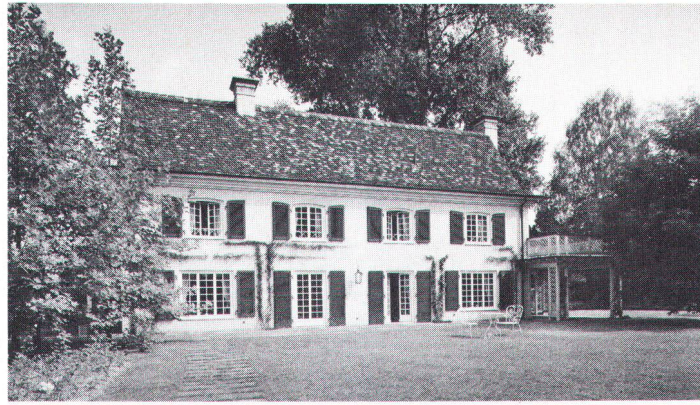
Landhaus in Riehen (Archivbild) Maison de campagne à Riehen

Die untrügliche Stilsicherheit , der seine Werke zeitlose Gültigkeit verdanken, gibt ihm auch den Mut, sich nie dem Diktat der Tagesmode zu beugen und mit seiner Meinung nicht hinter dem Berg zu halten. Anlässlich einer Südamerikareise erschrak er über die Sterilität der neuen Hauptstadt Brasiliens und auf dem Rückweg über die Freud- und Leblosigkeit von Le Corbusiers Hotel N'Gor in Dakar. An der Aurorastrasse , ob dem Sonnenberg in Zürich, schuf