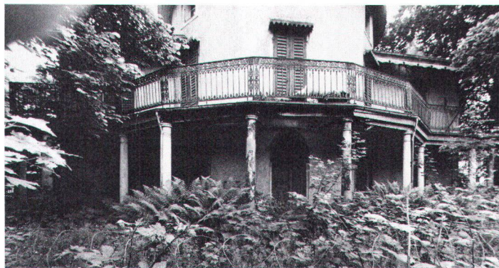
Wo ein Gebäude dem Zerfall preisgegeben wird, ist es kaum mehr zu retten

Nun bedingen noch lange nicht alle Mängel an einem alten Gebäude, dass sogleich mit dem eisernen Besen gekehrt wird. Im Gegenteil! Ein Umbau sollte eigentlich erst erwogen werden, wenn das gesteckte Ziel nicht mit « sanfteren » Methoden zu erreichen ist. Hierher gehören die Pflege und die Instandstellung. Grundsätzlich ist zu bedenken, dass jeder Bau ständig unterhalten werden muss. Wo kleine Schäden festgestellt werden, sollten sie sofort behoben werden – und zwar ohne dass gleich alles Alte durch Neues ersetzt wird. Häuser, die nicht regelmässig gepflegt werden, nehmen rasch Schaden. Richtiges Lüften des Hauses, das Kontrollieren des Mauerwerkes und der Dachrinnen, das Ausbessern von Fenster- und Türfugen, das Ersetzen defekter Dachziegel beispielsweise kostet wenig, wirkt vorbeugend und würde manchen Umbau überflüssig machen.