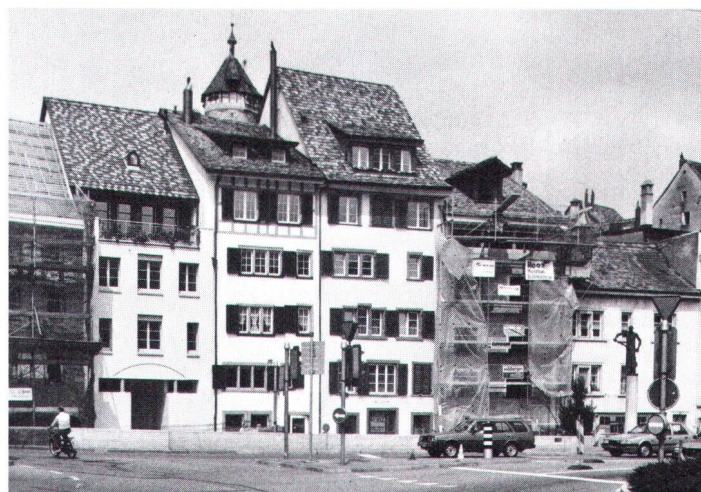
Kontinuierliche Pflege schont Haus, Geldbeutel und Ortsbild (im Bild Schaffhauser Altstadt)

Zum Beispiel: Ehemals bescheidene Scheunentore sollten nicht zu objektverzerrenden Prestigeportalen aufgepöppelt werden, nur weil die