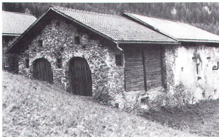
En Basse-Engadine: dépendance au toit rénové, mais abandonnée depuis des décennies.

S'il y a conflit entre utilisation agricole et sauvegarde de la substance architecturale, il faut, d'une part, que les exigences d'ordre agricole soient davantage équilibrées par la prise en considération des valeurs culturelles; et il faut, d'autre part, que la défense