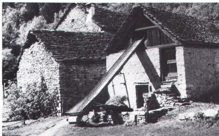
La technique – ici, une bande transporteuse provisoirement installée pour le foin – peut sauvegarder la substance architecturale.

Technik – in diesem Fall ein temporär eingesetztes Heuförderband – kann Bausubstanz schonen