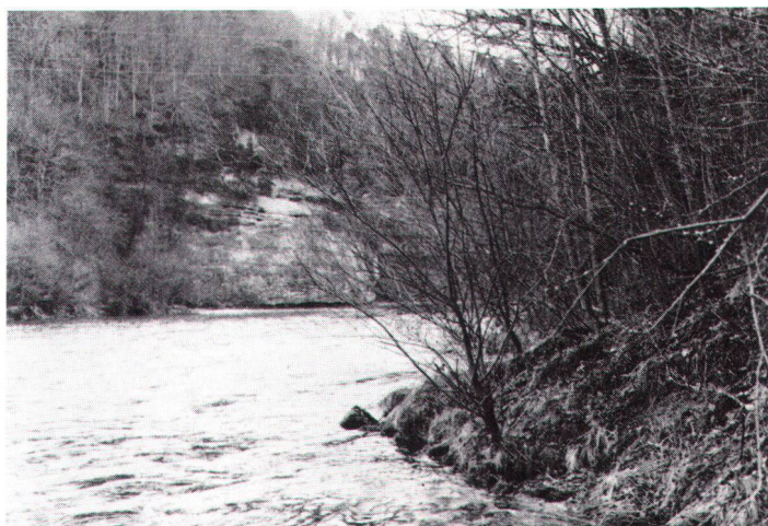
Au bord de la Sarine, près de Posieux. Am Saaneufer bei Posieux

Le Tribunal fédéral a donc annulé l'autorisation de défrichage. Il a jugé que les motifs d'étroitesse du terrain, invoqués par l'exploitante pour justifier la récupération de matériaux usagés au détriment de la forêt, ne sont pas admissibles puisque l'exploitante avait délibérément provoqué, dans un but purement finan-