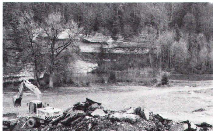
Retraitement de matériaux de construction en zone protégée. Bauschutttaufbereitung in geschützter Zone