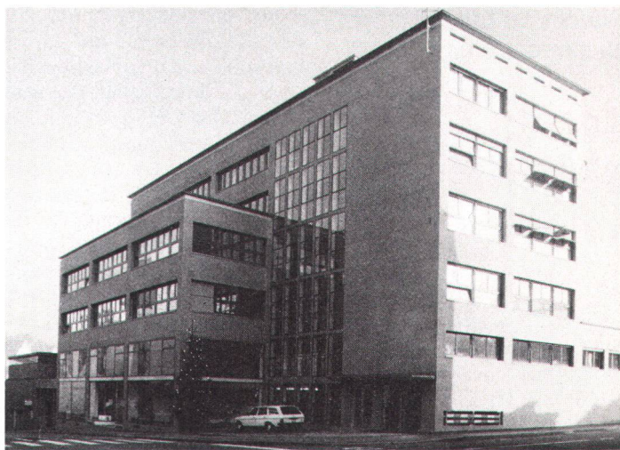
Das renovierte Verwaltungs- und Werkgebäude der Städtischen Werke Baden

Le bâtiment administratif et pour ateliers rénové par les Travaux publics de Baden.