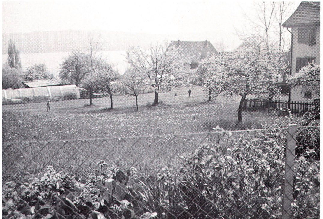
Der Bauernhof Schipfer in Zürich-Wollishofen ist von der Stadt an einen Landwirt verpachtet worden, der hier biologischen Landbau betreibt.

Aufgrund einer Analyse der Konflikte von Nutzungsmöglichkeiten gemäss Entwurf der neuen Bau- und Zonenordnung der Stadt Zürich wurden dem Hochbauamt konkrete Vorschläge zur Umzonung