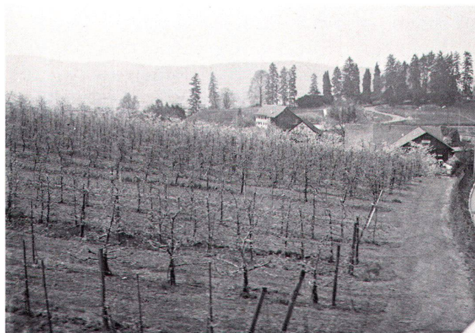
Obstplantage am Riedhoferberg in Zürich-Höngg, an der ein für die Stadtbewohner wichtiger Wanderweg vorbeiführt.

Im Rahmen dieser Arbeit wurde versucht, mit einer allgemeinen Schätzung die Grössenordnung dieser Beiträge abzuschätzen. Gesamthaft kann davon ausgegangen werden, dass im Maximum jährliche Mittel im Ausmass von rund 1 bis 1,5 Mio. Franken für Infrastrukturmassnahmen, für die Neuanlage von Landschaftselementen, für Nach-