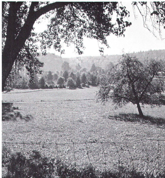
Espace de verdure en plein centre de Zurich-Schwamendingen. Städtische Grünanlage mitten im Ortskern von Zürich-Schwamendingen.

sion des terres, utilisation intensive pour le délassement des citoyens, pollution, etc.), mais joue un rôle extrêmement important pour la sauvegarde du paysage, des zones vertes, de la faune et de la flore, du micro-climat et des réserves hydrauliques.