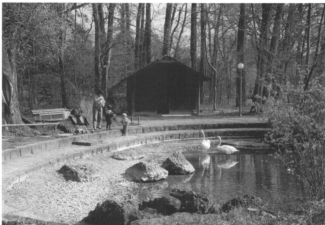
Cham a reçu le prix Wakker pour son souci de préserver et entretenir ses espaces verts.