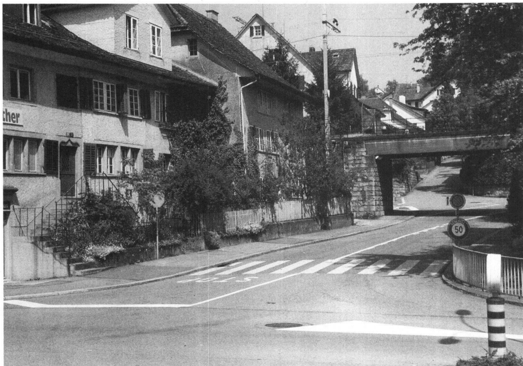
La voie ferrée de la rive droite du lac de Zurich doit être doublée. Cela peut porter atteinte au centre encore intact du village de Zollikon.

La voie ferrée de la rive droite du lac de Zurich – plaisamment appelée «Côte de l'or» en raison de l'importance fiscale de ses résidents – traverse le centre du village de Zollikon, qui s'étire le long d'une rue en pente depuis la rive jusqu'à l'église située quelque 70 m plus haut. A cette croisée, une autre route passe sous le ballast. Dans le cadre du réseau régional zuricois, la ligne doit maintenant avoir une double voie, et à cette occasion la Commune voudrait améliorer le tracé routier. Tout cela menace d'altérer plus encore le centre du village, mais le très actif groupe local du «Heimatschutz» – avec le droit de recours de la LSP en réserve – a soumis aux CFF un plan qui adoucit les effets du projet.