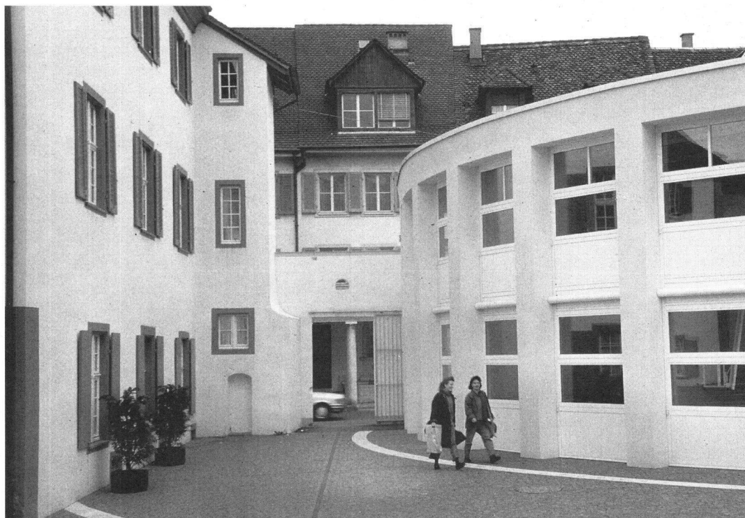
Le quartier de St-Alban, à Bâle, est devenu un lieu de pèlerinage pour spécialistes et profanes que préoccupe la continuité urbanistique.

Dans le cas de la nouvelle antenne du Bantiger, près de Berne, les PTT et la LSP n'ont pas – contrairement à d'autres précédents – déterré la hache de guerre. Les PTT ont organisé un concours, sur invitation, et accepté pour l'élaboration du programme le vœu de la LSP de laisser une plus grande liberté dans le choix de l'emplacement. Ce choix était d'une particulière importance, parce que le sommet du Bantiger, tel un dos de chameau, présente des bosses d'une certaine hauteur pourtant différente et une «ambiance» exceptionnelle, que souligne encore la forêt environnante. Plusieurs projets ont abandonné la symétrie centrale de base en usage pour ces sortes de construction, notam-