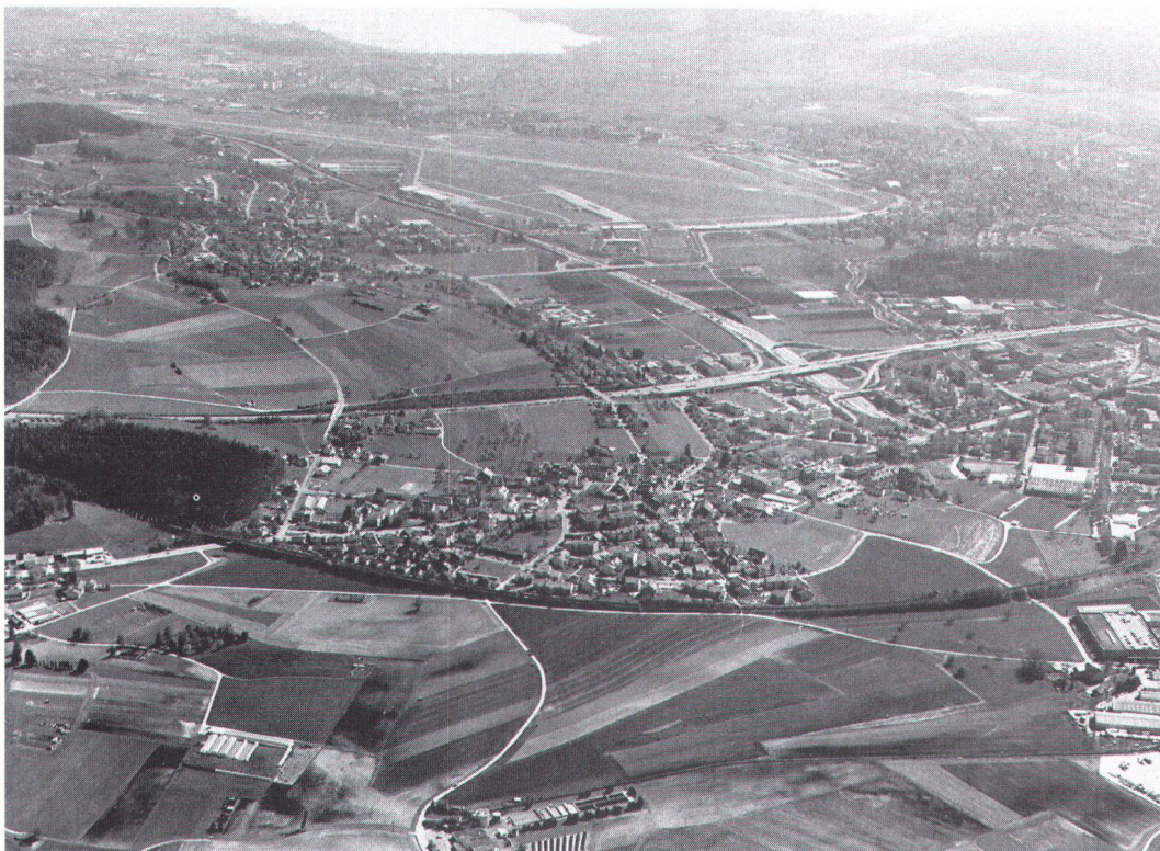
Changements d'aspect d'une agglomération – ici dans la vallée de la Glatt ZH: naguère paysage de marais (photo de gauche, 1923); aujourd'hui nœud routier et centre de développement des services de toute espèce (photo de droite, 1991).