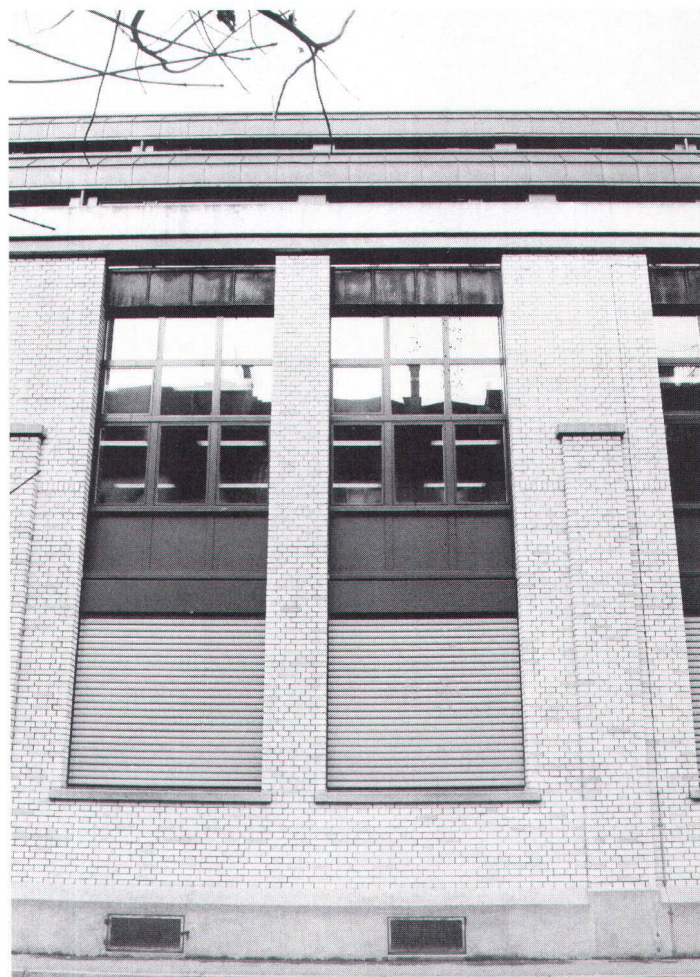
Dem baulichen Detail wird die gleiche Aufmerksamkeit zuteil wie der planerischen Arbeit.

Die Stiftung Baukultur ist eine wirtschaftlich tätige Institution mit gemeinnützigen Zielen. Für den Umgang mit Altbauten hat sie sich in einer eigenen Charta strenge Grundsätze gesetzt. Sie regeln integrales Erhalten gewachsener Strukturen und ermöglichen gleichzeitig die angemessene Erneuerung. Die Stiftung wendet sich sowohl an Private wie an öffentliche Institutionen. In einer ersten Stufe bietet die Stiftung als Dienstleistung eine Beurteilung der Bausubstanz an in Bezug auf geschichtlichen Wert, Zustand und Standort. Sie ist die Grundlage für das folgende Gespräch über die Definition einer künftigen Nutzung unter den gegebenen Voraussetzungen und bei der Bestimmung