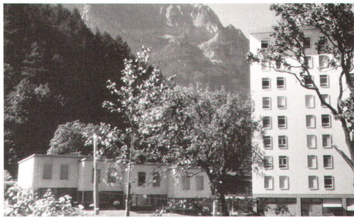
Rechts das Personalhochhaus, links das Ärzteshaus des Kantonsspitals Glarus, die in ihrer Fassadenstruktur hätten wesentlich verändert werden sollen

Das zeigte sich nun an der 1992 von der Glarner Landsgemeinde beschlossenen Sanierung des Hochhauses. Diese sah vor, dessen Aussenwände rundherum mit einer Wärmeisolierung zu versehen. Das damit beauftragte Architekturbüro schlug dabei vor, die ganze Fassade mehrfarbig mit Eternit zu verkleiden und vorgehängte Sonnenschutzblenden einzubauen. Gegen eine solche Lösung, welche den Gebäudecharakter erheblich verändern würde, wehrte sich aber der Schöpfer des seinerzeitigen Projektes, Jakob Zweifel. Nicht nur, weil er das Erscheinungsbild des Massivbaues erhalten möchte, sondern weil