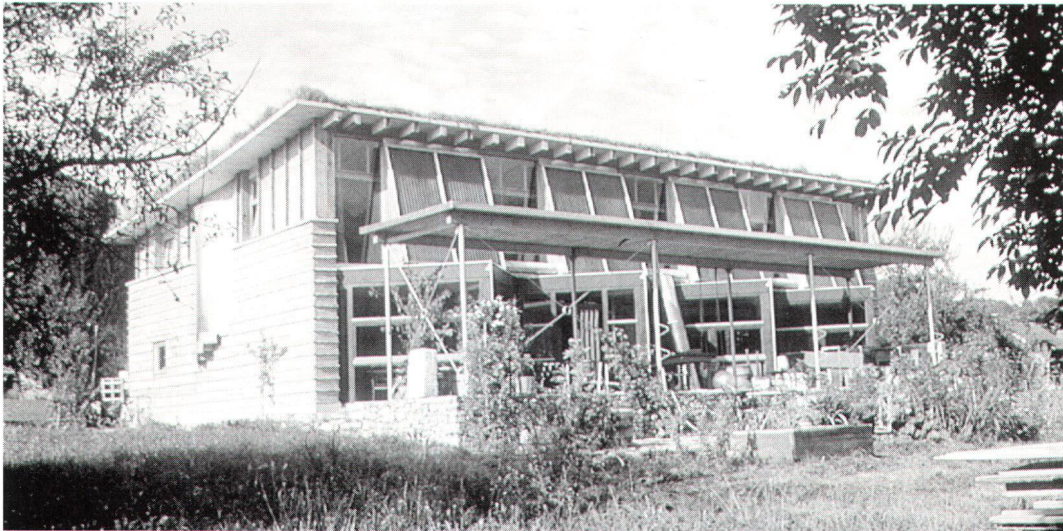
Beim Atelier Rauch in Schlins wurden die neuen Materialien und Fassadenelemente (Lehm/Solarzellen) nicht einer traditionellen Bauweise übergestülpt, sondern führten mit Stahl, Beton, Glas und Holz zu einem formal überzeugenden Ausdruck.

Pour l'atelier Rauch, à Schlins, les nombreux matériaux et éléments de façade (glaise, cellules solaires) n'ont pas été superposés à la construction traditionnelle, mais l'acier, le béton, le verre et le bois ont créé un aspect convaincant.