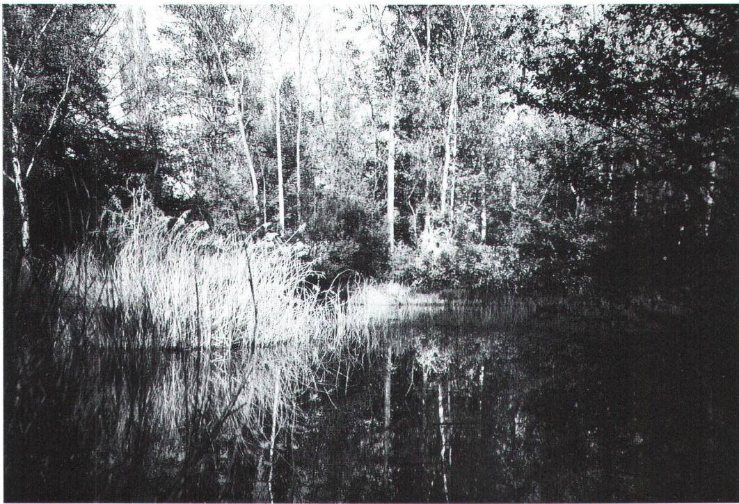
Üppige Vegetation prägt den Bouget-Park in Vidy.

Une végétation luxuriante caractérise le parc du Bourget, à Vidy.