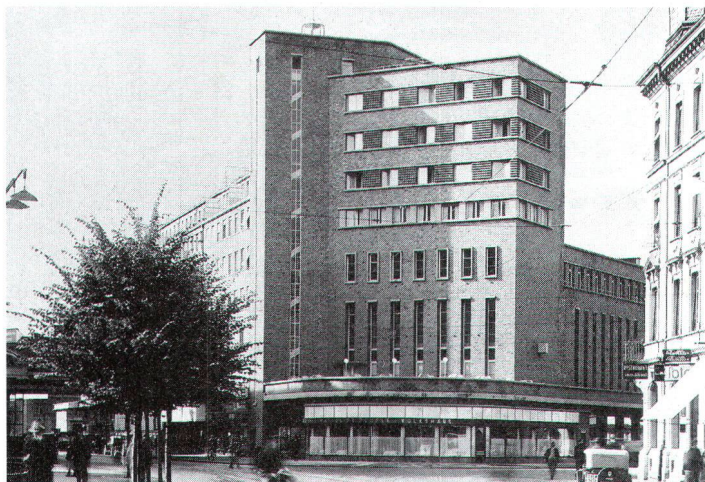
Das Volkshaus Biel wurde 1929–1932 von E. Lanz erstellt und nach Auseinandersetzungen erneuert und wiederbelebt. (Archivbild)

Ungleich geringer hingegen ist unsere Kenntnis jener anderen Bewegung zwischen den Polen des radikalen Funktionalismus und des Heimatstils, die das Bauen in der Schweiz mengenmässig nicht unwesentlich mitbestimmt haben. Zu denken wäre hier etwa an die Stuttgarter Schule, die Weiterentwicklung des Modells des englischen Hauses,