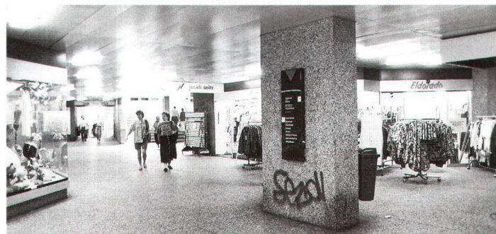
Un passage souterrain peut-il vraiment remplacer les espaces publics à ciel ouvert?

bauen wir uns die Chance auf eine Zukunft». Als mögliche Übungsplätze für eine neue Aussenraumkultur bezeichnet Barbara Zibell die transitorischen Räume, beispielsweise die vielen undefinierten Räume am Rande der Agglomeration oder die grossen Brachflächen, welche die ausgelagerte Industrieproduktion im Innern der Städte zurückgelassen hat.