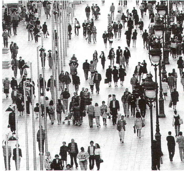
Die Puerta del Angel in Barcelona – ein öffentlicher Raum, der von allen genutzt werden kann und auch wird. (Bild aus Barcelona Public Space) La Puerta del Angel, à Barcelone – un espace public qui peut être utilisé par tous, et l'est effectivement.

Da gibt es nur ein Problem: Niemand will die Plätze in den Zentren richtig in Besitz nehmen. Und die Stadtbewohner, die gerne möchten, bilden oft