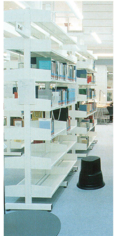
Innen oder aussen? Die Basisbibliothek vor historischer Fassade, rechts angeschnitten eine der Bücherplattformen.

• Erstens: Die UNITOBLER ist ein Einzelstück. Sie entzieht sich der Nachahmung. Ein alter Bau kann, selbst wenn er tiefgreifend verändert worden ist, Identität, Lebensstil, Kontinuität (und letztlich auch Heimatgefühl) stiften. Dies sind Qualitäten, die in der Architekturdebatte an der Neige unseres «modernen» 20. Jahrhunderts zu Recht (wieder) diskutiert werden.