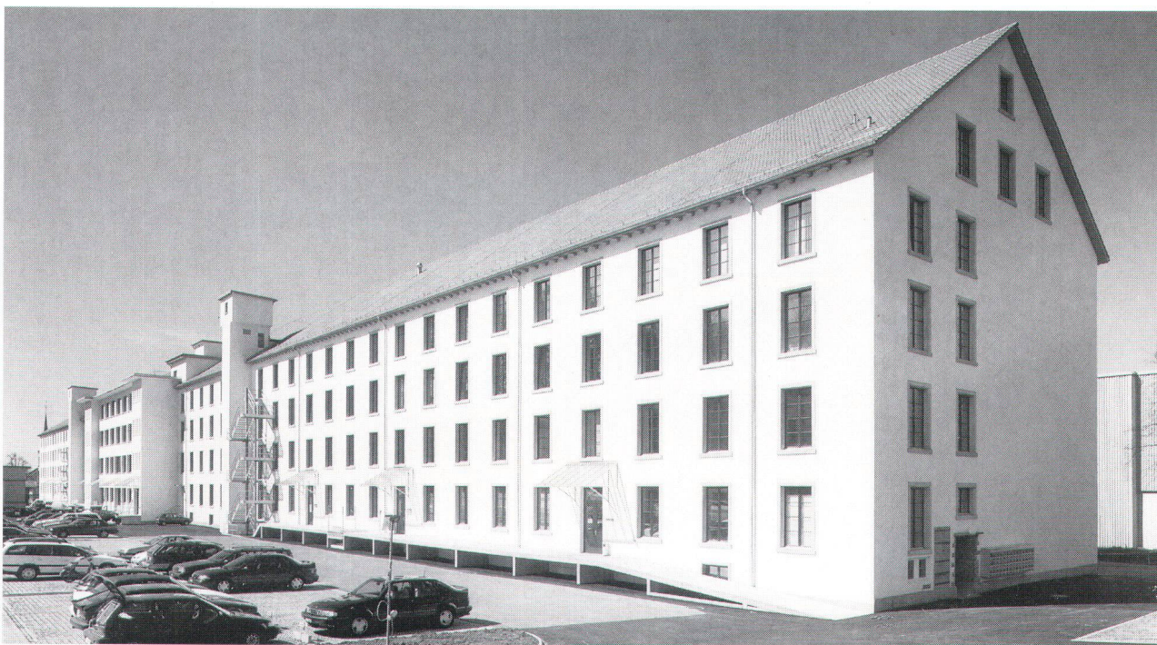
Arrière du bâtiment restauré de la filature de Baar et espace libéré par la démolition des annexes.