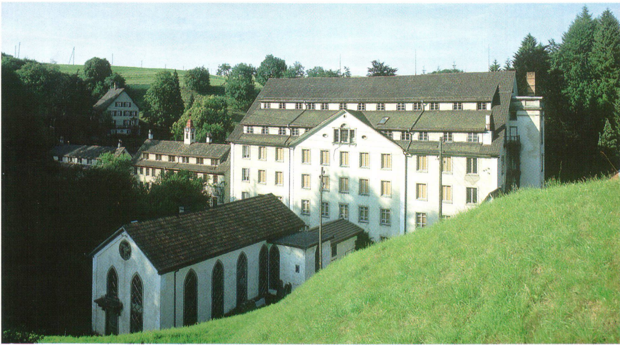
Eine Spinnerei als Teil des grossräumig angelegten Industriellehrpfades Zürcher Oberland. Une filature faisant partie de l'itinéraire de découverte des sites industriels de l'Oberland zurichois.