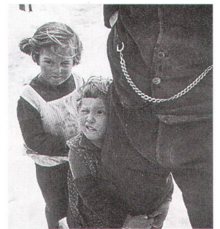
Oben: «Der Vater» von Theo Frey (1936); unten: «Alpabfahrt» von Eliza Lima (1995).

richtete Fachtagung über «Umnutzung – Wakker-Preis 1997 Bern». Ihr roter Faden: mit welchen Argumenten und Fragen wird man bei einer Umnutzung konfrontiert? Ferner stehen öffentliche Führungen durch umgenutzte Industrieanlagen auf dem Programm. Gleichentags übergibt der Schweizer Heimatschutz der Stadt Bern offiziell den Wakker-Preis 1997. Abschliessend erhalten die Unverdrossenen noch die Gelegenheit, mit drei Exkursionen Unbekanntes in der Umgebung von Bern zu besuchen. Nähere Unterlagen hält die Regionalgruppe Bern des Berner Heimatschutzes, Postfach, 3000 Bern 7 bereit.