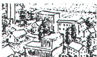
C Erhaltungsziel C Erhalten des Charakters: