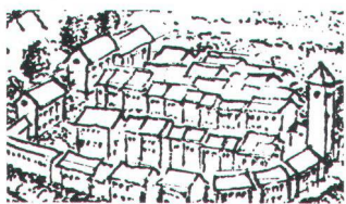
A Erhaltungsziel A Erhalten der Substanz:

Mit Hilfe des ISOS lassen sich geeignete Massnahmen für ein Gebiet oder eine Baugruppe bestimmen.