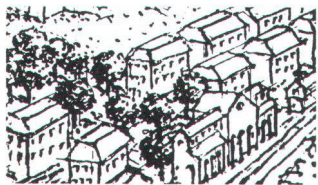
B Erhaltungsziel B Erhalten der Struktur: