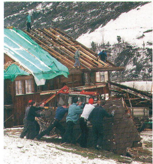
Aufräumen nach den Verwüstungen «Lothars» in St. Stephan BE. Travaux de déblayage après le passage de «Lothar» à St. Stephan/BE.