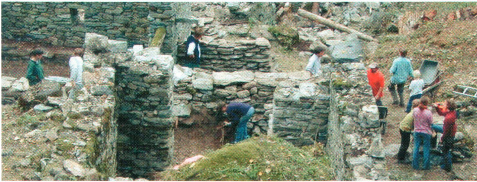
Während der Arbeits- und Ferienwoche konnten die Teilnehmer(innen) die «Steinbauweise» für einmal am eigenen Leib erfahren. Durant cette semaine de travail et de loisirs, les participantEs ont vraiment expérimenté la construction pierre par pierre.