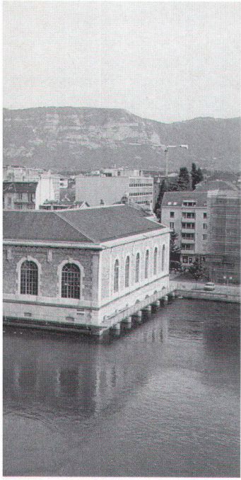
La passerelle latérale le long du bâtiment des Forces Motrices transformé en centre culturel prolonge la promenade de la digue «au fil du Rhône» à Genève.

Genève s'identifie au Rhône depuis des siècles. En même temps que la ville se développait, les rives du fleuve étaient l'objet de transformations importantes. Les bâtiments industriels construits au XIXe siècle, en particulier, leur donnent un aspect aujourd'hui unique en son genre. Lorsque, au début des années 90, le dispositif de régulation des eaux du Léman a été déplacé en aval, ces remarquables bâtiments ont perdu leur fonction.