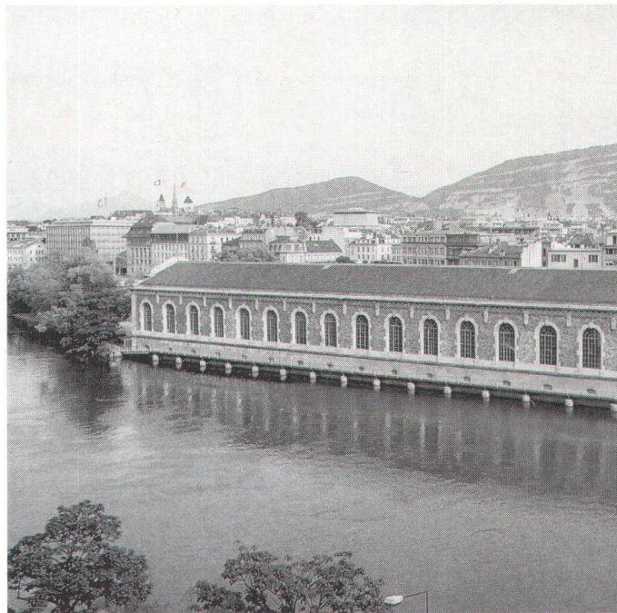
Der Steg an der Aussenseite der zum Kulturzentrum umgebauten Forces Motrices setzt die Dammpromenade am Genfer Rhoneufer fort. (Bild Descombes)

und der alte Bezug der Stadt zum Wasser wieder erlebbar gemacht werden. 1993 gab der «Fonds municipal d'art contemporain» eine Studie zur Aufwertung des Ufer Raumes in Auftrag. Der 1950 gegründete Fonds unterstützt und fördert zeitgenössische Kunst, untersteht der städtischen Exekutive und verfügt über 1% aller Kredite, die an städtische Bauvorhaben und Renovationen gesprochen werden. Die Aufgabe wurde dem Genfer Architekten Julien Descombes anvertraut, welcher gemeinsam mit Künstlern ein Konzept ausarbeitete. Im Bewusstsein um den einzigartigen städtischen Lebensraum am Wasser hiess die Genfer Stadtregierung 1994 das Projekt «Le Fil du Rhône» gut. Damit begann eine intensive Zusammenarbeit zwischen dem Stadtplanungsamt, dem «Fonds municipal d'art contemporain», dem kantonalen sowie dem städtischen Bauamt.