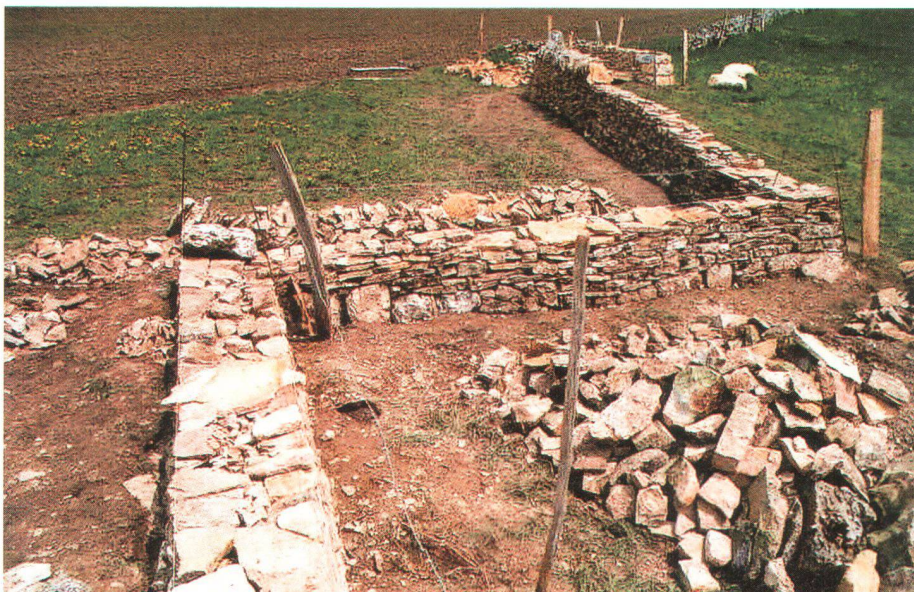
Le Bémont : mur en voie de restauration par la lauréate du prix «Heimatschutz» Eine von der diesjährigen Trägerin des Heimatschutzpreises in Restauration begriffene Mauer in Le Bémont