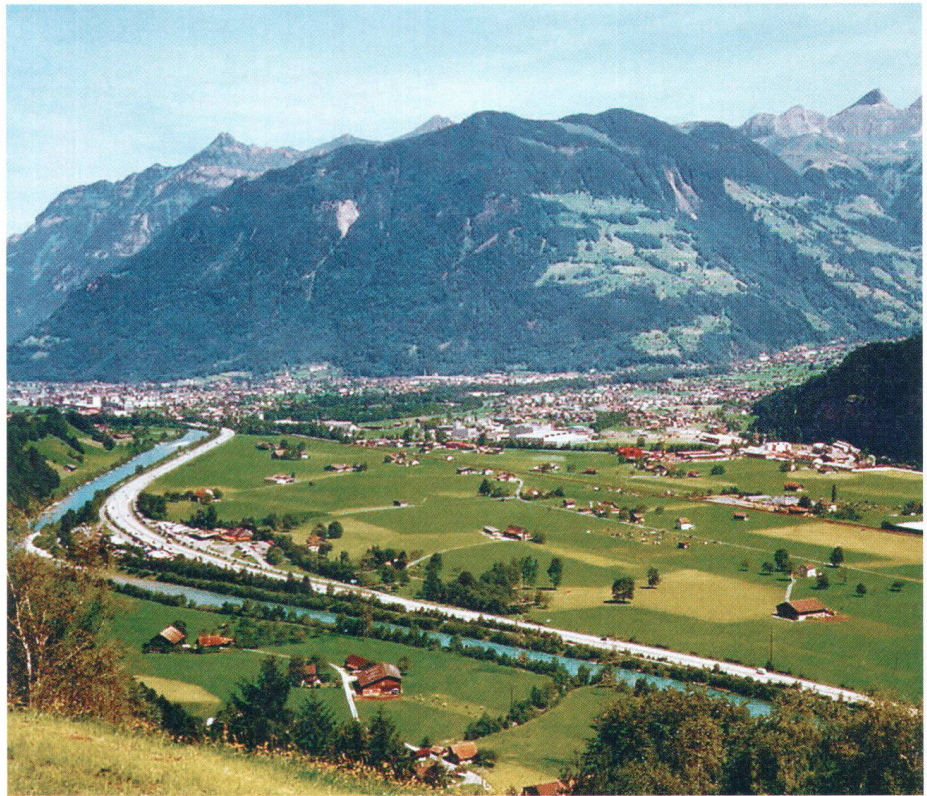
Blick auf die Urner Reussebene mit der Gotthard-Autobahn und im Hintergrund Altdorf Vue de la vallée uranaise de la Reuss avec, en arrière-plan, Altdorf

Zu Handen der Delegiertenversammlung verabschiedete der Zentralvorstand ferner den Jahresbericht und die Jahresrechnung 2002 sowie Vorschläge für ein neues Mitglied im Geschäftsausschuss und ein Ehrenmitglied, auf die wir im Zusammenhang mit der DV zurückkommen werden. Abgelehnt wurde jedoch eine Praxisänderung beim Erheben der Zentralbeiträge. Sodann wurde das Gremium mit der ab sofort im Internet einsehbaren roten Liste von gefährdeten Heimatschutzobjekten vertraut gemacht (siehe Beitrag auf Seite 24). Im Weiteren bestimmte der Vorstand die Träger des diesjährigen Heimatschutzpreises und des Schulthess-Gartenpreises, auf die in dieser und in der nächsten Ausgabe separat eingegangen wird. Informiert wurde auch über den Stand der Projekte «Bahn 2000» und NEAT und namentlich über deren Begleitung und Einflussnahme durch die Umweltorganisationen sowie über die Revision des Lotteriegesetzes. Der Vernehmlassungsentwurf zu Letzterem enthält einige Neuerungen, sieht aber vor, dass das Lotteriemonopol der Kantone beibehalten wird. Ob und wie sich das auf die seit Jahren geplante Lotterie «Umwelt und Entwicklung» auswirken wird, ist unklar. Schliesslich pflichtete der Zentralvorstand 15 vom SHS seit Ende Oktober 2002 in zehn Kantonen eingereichten Einsprachen und Beschwerden bei.