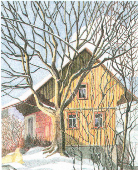
Eine Villa im Park? Ein Stall mitten im Dorf! Une villa dans le parc? Une étable au milieu du village!

red. Er ist in St. Gallen aufgewachsen, arbeitete während rund 40 Jahren als Textilentwerfer und fast so lange auch als Fachlehrer für Textilentwurf und Naturzeichnen. Daneben wirkt(e) Urs Hochuli als Zeichner an verschiedenen Projekten, Publikationen und Ausstellungen. Zu seinen beliebtesten Sujets gehört das Nebensächliche im Ortsbild, das er an seinem Wohnort in Skizzen einzufangen pflegt. 1984 erhielt er den Anerkennungspreis der Stadt St. Gallen zugesprochen.