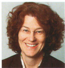
Ruth Genner, Nationalrätin und Präsidentin der Grünen Schweiz, Zürich