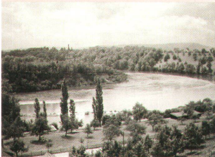
Rheinau vor dem Kraftwerkbau

Die Bauberatungsstelle unter Max Kopp konzentriert sich auf einzelne Bauten und Baugruppen in ländlichen Gebieten. Für verschiedene, auf dem Taler abgebildete Projekte