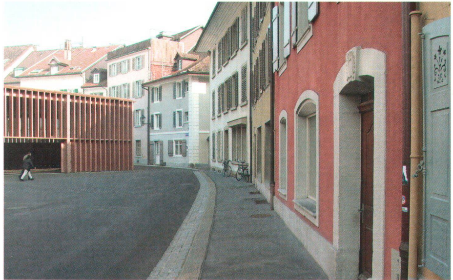
Grundlagenforschung im öffentlichen Raum ist einer der zentralen Aufmerksamkeitsbereiche des Heimatschutzes. Die Markthalle in Aarau wurde von der Sektion Aargau ausgezeichnet