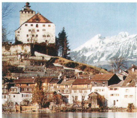
65 Mio. Franken hat der Taler bis heute an die Pflege von Ortsbildern (links Werdenberg) oder z.B. industriekultureller Objekte geleistet