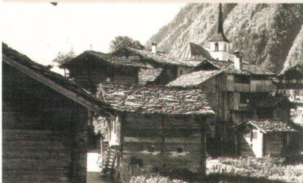
Blatten, modèle touristique de Ps

Patrimoine suisse cède plusieurs de ses domaines d'activité marginaux à des organisations à buts apparentés, et concentre ses efforts sur la sauvegarde de la substance architecturale historique en régions rurales et urbaines. La commission des costumes et chants folkloriques se sépare de Patrimoine suisse en 1926 et devient indépendante sous le nom de Fédération nationale des costumes suisses. Le Schweizer Heimatwerk prend en 1930 la succession de la coopérative de vente, dissoute l'année précédente. Sur le plan financier aussi, l'organisation repose sur de nouvelles bases. Le produit du Don suisse de la fête nationale de 1933 revient entièrement à Patrimoine suisse et à la Ligue suisse pour la protection de la nature (LSPN, aujourd'hui Pro Natura). Patrimoine suisse consacre la somme reçue à l'organisation d'un secrétariat. Ernst Laur devient en 1934 le premier secrétaire général de Patrimoine suisse.