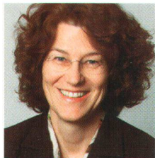
Ruth Genner, Conseillère nationale et présidente des Verts de Suisse, Zurich