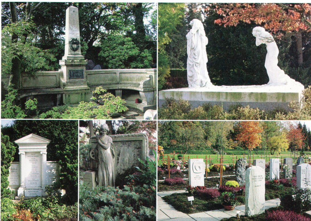
Links oben/unten, rechts oben: das Familiengrab des 19. Jh. als Kunstwerk und Statussymbol; rechts unten: moderne Einzelgräber von vornehm bis schlicht