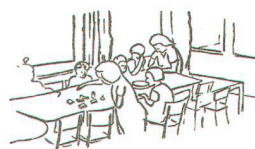
Abb. 14. Der Familientisch ist kein höherer Begriff, sondern eine Wirklichkeit, welche auf die Kinder gemeinschaftsbildend einwirkt.

Für die Zeitgenossen wohl wichtigster Punkt, auf den die an Bedeutung wachsende Landesplanung hinwies, war die simple Erkenntnis, dass der Raum als Ressource begrenzt war und somit haushälterisch mit ihm umzugehen war. So flächenintensiv, wie noch die Kriegssiedlungen geplant worden waren, durfte man nicht