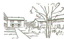
Abb. 15. Der bauliche Ausdruck einer guten Nachbarschaft ist die Wohngruppe, und wie die Kinder um den Tisch, gruppieren sich die Bauten um einen gemeinsamen Platz.