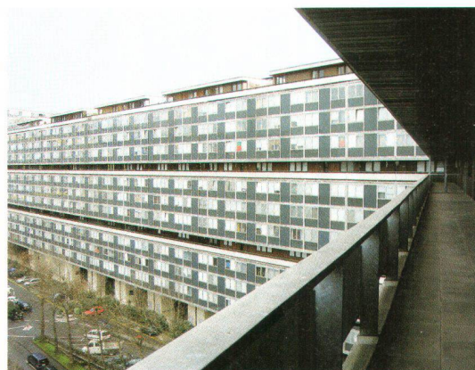
Dans les années 60, de grands lotissements comme la cité satellite de Meyrin ou les tours de Carouge apparaissent à Lausanne et Genève. La Cité du Lignon en périphérie de Genève (architectes Addor, Juillard, Bolliger, Payot, 1962–1971) représente la cité satellite typique In den 1960er-Jahren entstehen in Lausanne und Genf grosse Ensembles wie die Cité satellite de Meyrin oder die Tours de Carouge. Die Cité du Lignon ausserhalb von Genf (Architekten Addor, Juillard, Bolliger, Payot, 1962–1971) verkörpert die typische Satellitenstadt

Des impulsions innovatrices sont également venues en 1950 de Suisse romande où l'Architecture Moderne avait été beaucoup plus largement acceptée. Les nouveaux quartiers de la périphérie de Genève et de Lausanne, inspirés de la reconstruction française, recourent largement aux toits plats et squelettes de béton ainsi qu'aux éléments préfabriqués des bâtiments de 1930. Les « grands ensembles » ou villes satellites ont constitué, en Suisse romande particulièrement, le champ d'activité principal des architectes.