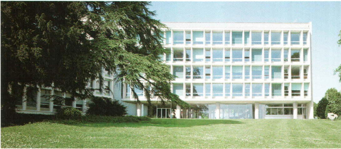
Le bâtiment de la Vaudoise Assurances à Lausanne (1952–1956) est une construction typique du mouvement moderne romand d'après-guerre. L'architecte Jean Tschumi employa de nouveaux matériaux pour la réalisation de ce bâtiment et accorda une importance particulière à son implantation dans le paysage Das Gebäude der Vaudoise Versicherungen in Lausanne (1952–1956) ist ein Vorzeigebau der Westschweizer Nachkriegsmoderne. Der Architekt Jean Tschumi verwendete bei diesem Gebäude neuste Materialien und legte besonderen Wert auf die Einbettung in die Landschaft