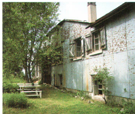
Les Mollards-des-Aubert, Le Brassus VD

Die Casa Döbeli in Russo im Onsernetal gehört der Tessiner Sektion des Heimatschutzes. Das einfache, zweistöckige Bürgerhaus aus dem 17./18. Jahrhundert vermittelt schlichte Eleganz. Die Loggia, welche auf der Südseite die Zimmer miteinander verbindet, sorgt für einen Hauch südlichen Lebensgefühls. Es ist geplant, noch diesen Sommer mit den Renovationsarbeiten zu beginnen, so dass ab nächstem Sommer darin zwei Wohnungen zur Verfügung stehen werden.