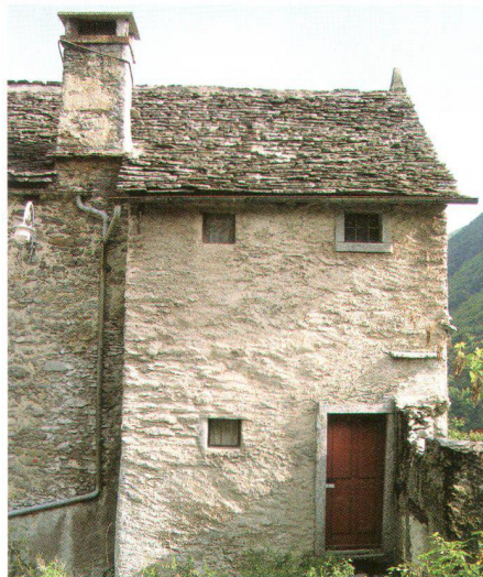
Casa Döbeli, Russo TI