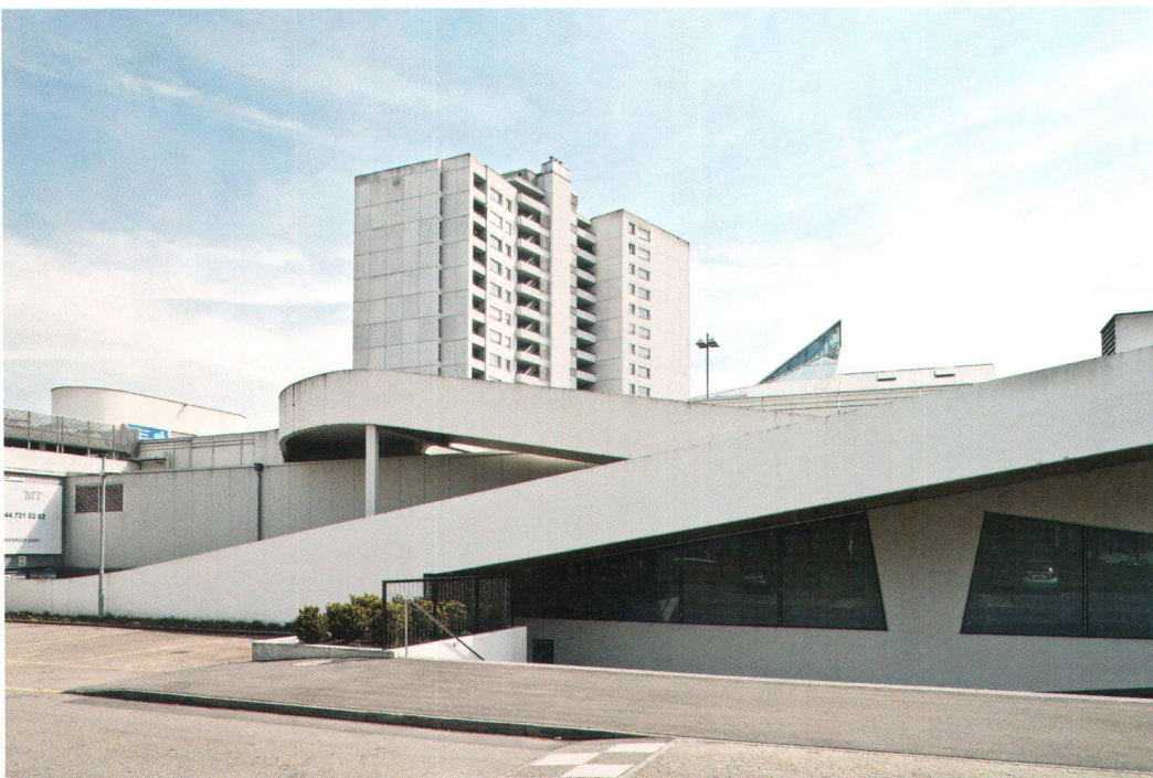
Von der Stadt aus gesehen ist das Hochhaus ein Teil der Betonlandschaft im Schönbühl...