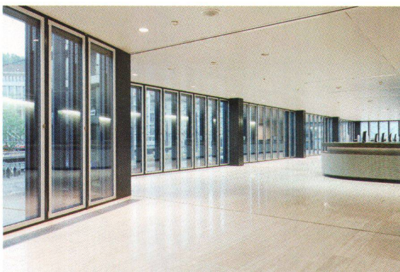
Die helle Schalterhalle mit Blick auf den Bahnhofplatz

Luminosité du hall des guichets donnant sur la place de la Gare