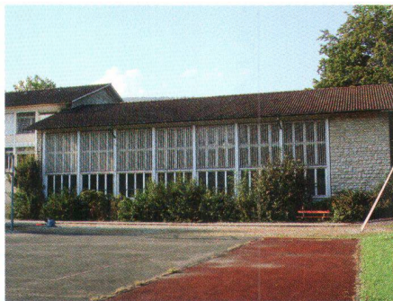
Collège de Delémont, 1953, de Hans et Gret Reinhard, Berne