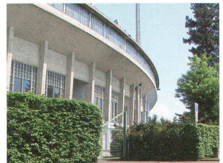
Olympiastadion Pontaise in Lausanne, 1954, von Charles-François Thévenaz. Dieser bedeutende Zeuge der Stadionarchitektur weist ausnehmend viel originale Bausubstanz auf. Trotzdem ist er wegen einer geplanten Wohnüberbauung vom Abbruch bedroht

Nur wenige der aufgelisteten Gebäude sind in einem Inventar erfasst. Wohl haben insbesondere Städte wie Genf, Bern, Basel oder Zürich ihre Inventare bis in die 70er-Jahre ergänzt, in den meisten anderen Ecken der Schweiz herrscht aber diesbezüglich ein baukultureller Dämmer schlaf. Wenn wir den kommenden Generationen die Baukultur der Nachkriegszeit weitergeben wollen, müssen Kantone und Gemeinden ihre vorhandenen Inventare schützenswerter Bauten mit Gebäuden der 50er- und 60er-Jahre ergänzen. Die herausragenden Bauten müssen als Baudenkmäler anerkannt und verbindlich geschützt werden, bevor es zu spät ist.