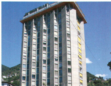
Casa Torre in Lugano, 1957, von Rino Tami

d'entraîner des pertes irrémédiables, comme récemment la démolition de la cantine du personnel de l'entreprise Sulzer, conçue par Edwin Bosshardt à Winterthur, ou celle de l'entrepôt Usego signé Rino Tami à Biornico.