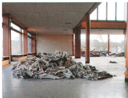
Abbruch des ehemaligen Sulzer-Wohlfahrtshauses in Winterthur, 2008. Einmal mehr ging ein wichtiger Architekturzeuge der 50er-Jahre wegen mangelnder Wertschätzung verloren

Die meisten der erwähnten Bauten fristen ein unbeachtetes Dasein und können von heute auf morgen durch unsensible Sanierungs- oder Abbruchpläne in Gefahr geraten. «100 × Aufschwung» soll einem möglichst breiten Publikum die Augen für die Vielfalt und den Wert der Nachkriegsarchitektur öffnen. Nach wie vor führt das schlechte Image zu unwiederbringlichen Verlusten, wie unlängst der Ab-