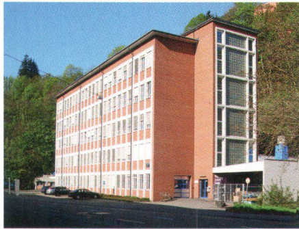
Zentrallabor Georg Fischer AG in Schaffhausen, 1957, von Adolf Kellermüller

Les constructions répertoriées sont pour la plupart méconnues. Elles sont par conséquent à la merci d'assainissements grossiers ou de plans de démolition. « L'envol × 100 » a pour objectif de sensibiliser un vaste public à la diversité et aux qualités de l'architecture d'après-guerre. L'image négative de cette architecture continue