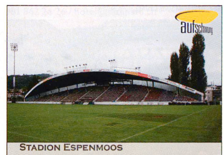
Stadio di Cornaredo, Lugano

Le FC Bienne, fondé en 1896, joue ses matches à domicile au Sportstadion Gurzelen (arch. F. Moser) depuis 1951. La construction en béton de la tribune se caractérise par un toit légèrement incliné vers l'arrière et une construction porteuse marquante. L'avenir de la tribune est incertain, alors même qu'elle figure à l'inventaire des monuments de la ville dignes de protection.