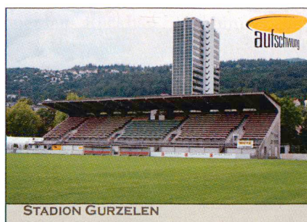
Stade Gurzelen, Bienne

Le 16 juin 1954 a eu lieu, dans le stade olympique neuf (architecte C.-F. Thévenaz, ing. E. Thévenaz et P. Jaccard), le match d'ouverture des Championnats du monde de football. Les tribunes principales, qui se font face, sont recouvertes de spectaculaires ailes de toit en béton de 18 m de large et de 8 cm d'épaisseur à l'endroit le plus mince.