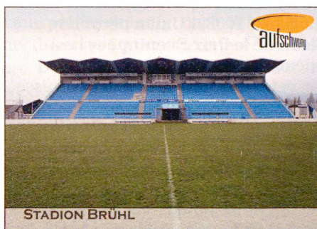
Tribüne FC Grenchen

Die Fussball-Europameisterschaft 2008 war Anlass, im Rahmen der Aufschwungkampagne einen Blick auf die Fussballstadien der 50er- und 60er-Jahre zu werfen. Die Sportanlagen jener Zeit müssen sich in ihrer architektonischen Qualität nicht vor den heutigen Stadien verstecken. Bewundert wurden vor allem die Bauten für die Fussballweltmeisterschaft 1954, zum Beispiel das (mittlerweile abgebrochene) Berner Wankdorfstadion und das aktuell durch eine neue Überbauung gefährdete Olympiastadion auf der Pontaise in Lausanne. Diese und einige weitere bemerkenswerte Fussballstadien aus der Zeit des Aufschwungs rief der Schweizer Heimatschutz mit sechs Sammelbildern in Erinnerung. Mehr dazu unter www.heimatschutz.ch/aufschwung .