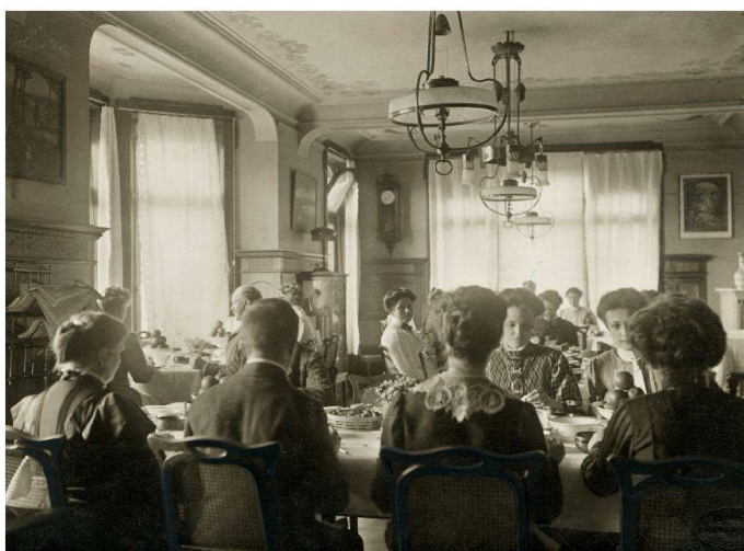
Zauberbergstimmung im Speisesaal des Sanatoriums «Lebendige Kraft» am Zürichberg um 1909.

Die inventarisierten Wege können online unter http://ivs-gis.admin.ch erkundet werden.