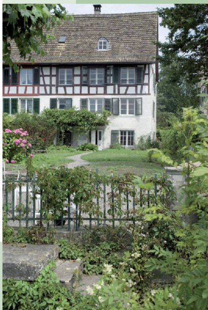
Haus Blumenhalde — Uerikon (ZH)