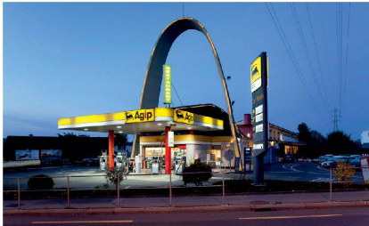
Wakkerpreis 2011, Lausanne West

Werden Sie Mitglied beim Schweizer Heimatschutz!