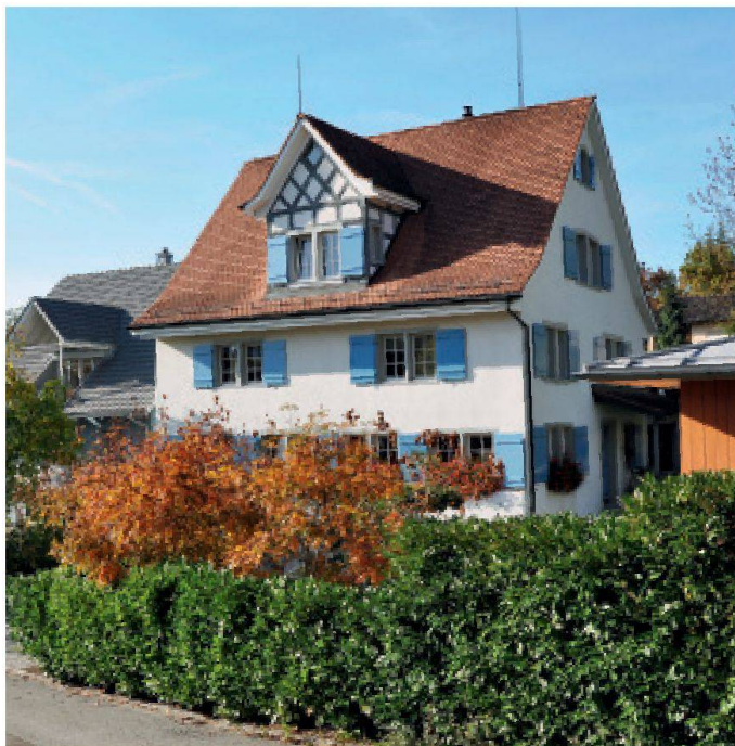
Männedorf: la ferme transformée où Max Frisch écrivit le roman Homo Faber.