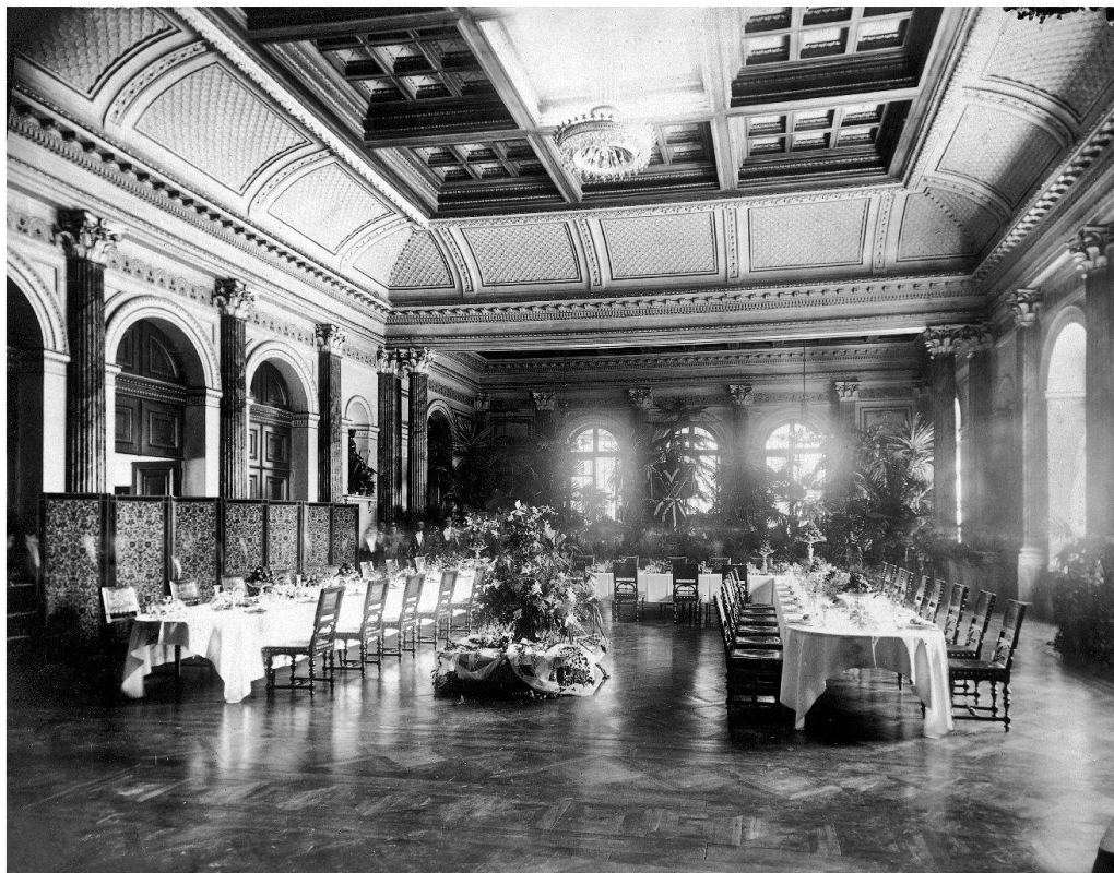
La Zeugheersaal, salle spécialement aménagée dans l'Hôtel Schweizerhof (1865) pour le banquet officiel du Conseil fédéral et du couple impérial.