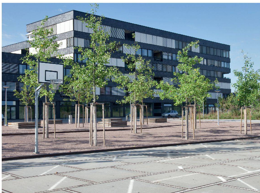
Der Erlenmattpark in Basel vom Landschaftsarchitekturbüro Raymond Vogel Landschaften AG Le parc Erlenmatt à Bâle du bureau d'architecture paysagiste Raymond Vogel Landschaften AG