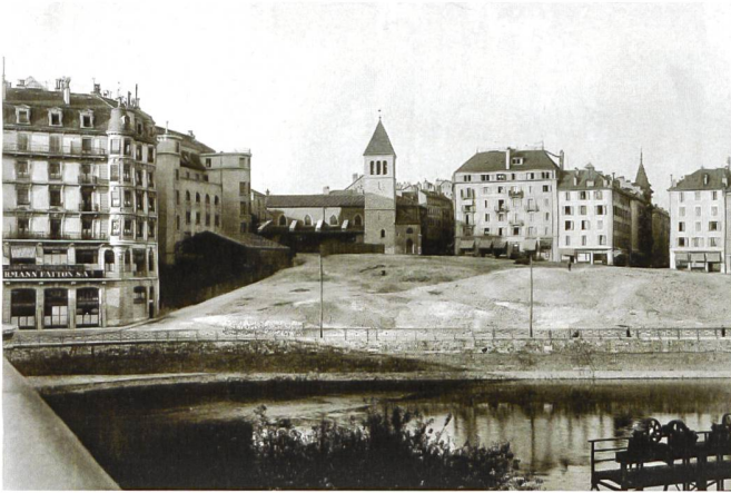
April 1934 – avril 1934

Julien, BGE, Centre d'icographie genevoise