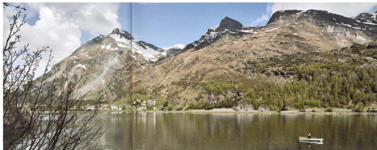
Der Druck auf das unüberbaute Land nimmt nur dann ab, wenn sich die Bevölkerung in verdichteten Siedlungen auch wohlfühlt (Silsersee im Obereingadin).

Es braucht hörbare Stimmen, die auf nationaler Ebene erklären, weshalb Verdichtung nicht nur als Auffüllen von Volumen verstanden werden darf, sondern als einmalige Chance, Dörfer und Städte positiv zu entwickeln und Fehler der Vergangenheit zu korrigieren. Besonders gefordert sind die Fachverbände, die verantwortungsvolle Architekten und Planerinnen in ihren Reihen haben. Sie und ihre Mitglieder müssen aktiv auf potenzielle Freunde aus anderen Lagern zugehen. Wer, wenn nicht engagierte Raumplaner, Städtebauer und Architekten könnten Bauern und Umweltschützer erklären, dass der Druck auf das unüberbaute Land nur dann abnimmt,