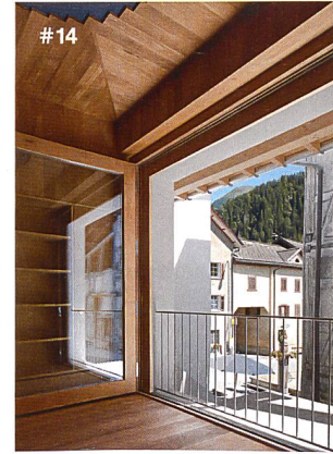
Alpines Museum der Schweiz

Nachhaltige Architektur in den Bergen prägt die Identität von Orten und schafft Räume, in denen sich Menschen wohlfühlen. Mit dem Architekturpreis «Constructive Alps» fördert das Bundesamt für Raumentwicklung der Schweiz und das Amt für Umwelt des Fürstentums Liechtenstein zukunftsfähiges und nachhaltiges Sanieren und Bauen im ganzen Alpenraum. Rund 400 Projekte wurden eingereicht, 32 nominiert, acht ausgezeichnet, vier prämiert.