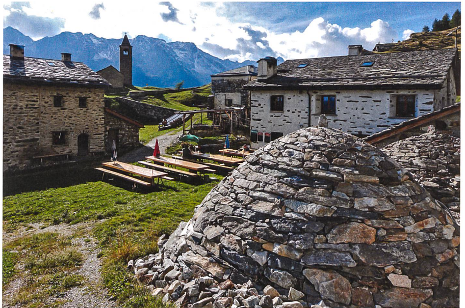
Im Vordergrund der perfekt wiederhergestellte Crot, rechts dahinter sein älterer Zwilling, im Mittelgrund der Halbkreis der Alpgebäude mit dem Wirtshaus rechts und im Hintergrund die 1106 erstmals erwähnte, romanische Wallfahrtskirche San Romerio.

Die Wiederherstellung dauerte fast vier Jahre und musste neben den normalen