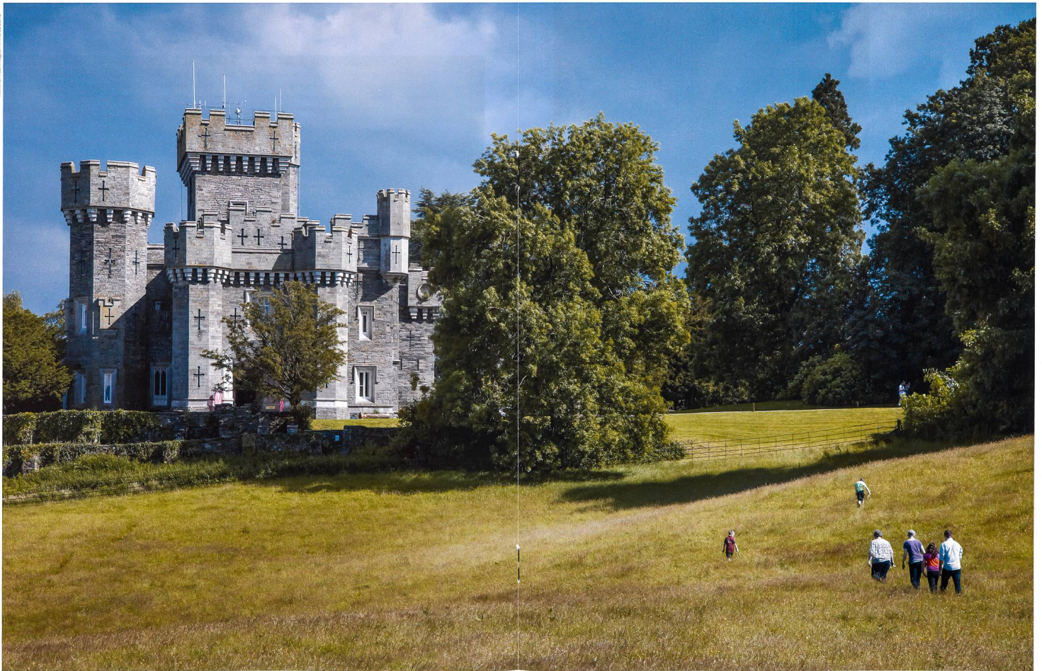
«Wray Castle», dans la région britannique des lacs (Lake District), est une fantastique forteresse de style néogothique édifée en 1840. Das «Wray Castle» im englischen Lake District, ein 1840 im neugotischen Stil erbautes Fantasieschloss