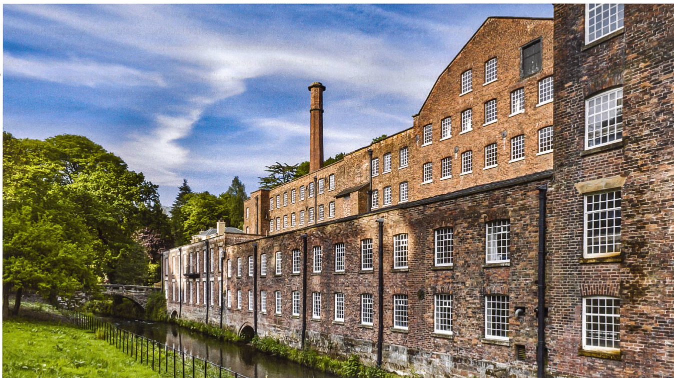
«Quarry Bank Mill», une ancienne manufacture de coton du XVIII e siècle, à Styal à proximité de Manchester