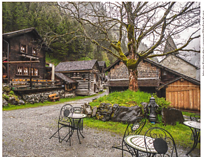
Vue depuis la place du village, avec le restaurant à gauche et l'église en arrière-plan

Der Blick vom Dorfplatz in die Siedlung zeigt das Restaurant auf der linken Seite und die Kirche im Hintergrund.