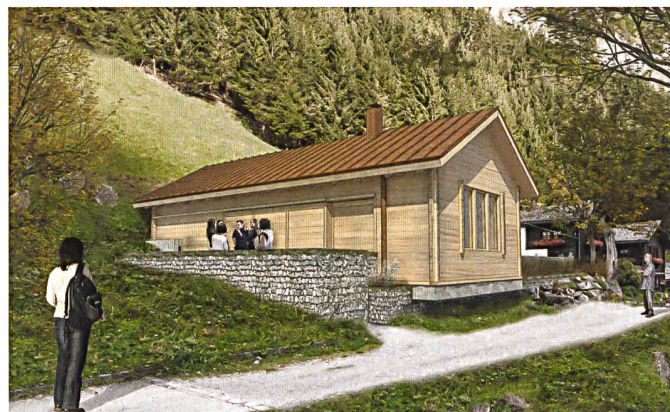
Haute-Ecole de Lucerne/Manuel Dahmen

→ Les travaux d'étudiants présentés aux pages 15 et 17 sont le reflet d'une approche différenciée de l'ensemble construit existant. Chaque projet fait appel à une stratégie différente: insérer, séparer, adapter, revisiter, altérer.